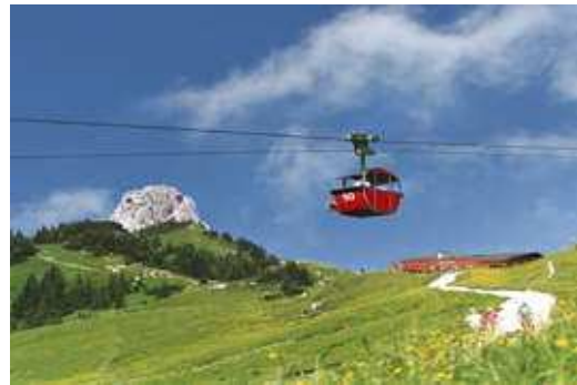
mit der Seilbahn hoch hinaus

Unser Senioren Stammtisch hält sein Grillfest im Hinterhof - dies auch soll im 2019 wieder stattfinden